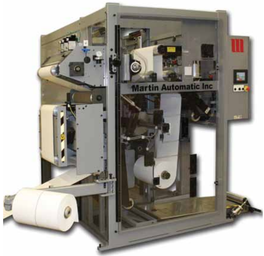
LRD 型不停机自动收卷机。(本机包含选购的分条、纠偏和收卷升降平台)