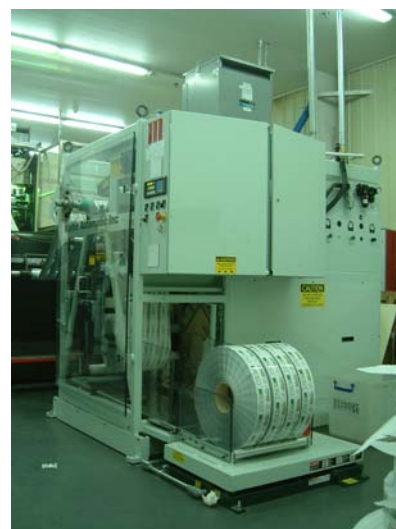
马汀 LR 型自动收卷机