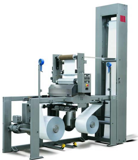
马汀 MBS 型自动放卷机

对生产实际而言，不停机自动上卷最直接的收益就是原材料的节约。据上海贝兹统计，每卷原料节约的长度大约有 10 米，相当于降低了 1% 的损耗。而对于上海贝兹而言，生产效率的提高不仅仅包括换卷时间的节省更关键的是印刷机可以持续不断地保持最佳速度运行，这对于印刷厂而言无疑是极佳的生产状态。统计数据显示，在安装了马汀的不停机自动放卷和收卷设备之后，上海贝兹的产量提升了近 30%。此外，马汀的不停机自动放卷和收卷设备还省去了换卷时的停车时间。生产实践表明，停车后再重新启动，会存在很大的套色误差，如此一来，马汀的不停机自动放卷和收卷设备使上海贝兹包装有限公司如获新生，真正高效率生产的梦想终于得以实现。